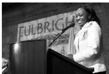
Ministra Paula Moreno

Ceremonia de entrega de becas Fulbright 2008 Página 1