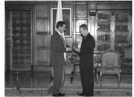
Fernando Araújo, Canciller, y William Brownfield, Embajador de EE.UU. en Colombia

El Embajador de Estados Unidos, William R. Brownfield, Presidente Honorario de la Junta Directiva de Fulbright, fue el encargado de recibir tan altas distinciones. Ex becarios, representantes del gobierno colombiano, miembros de la junta directiva de Fulbright, ex directores, y staff estuvieron presentes para atestiguar este reconocimiento al apoyo de la formación avanzada, el desarrollo y el mutuo entendimiento entre los dos países.