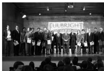
Becarios del Programa de Postgrado para las Regiones con representantes del Ministerio de Educación, DNP y Colciencias