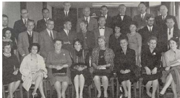
Miembros de la junta directiva, Director de la Comisión y funcionarios de 1961

Hoy, el Programa Fulbright celebra 50 años de trabajo en Colombia, durante los cuales ha trabajado en favor de la cooperación bilateral entre los dos países y el fortalecimiento del desarrollo académico y socioeconómico colombiano. Sus logros son fruto del enorme esfuerzo realizado entre un dedicado staff de profesionales y su junta directiva.