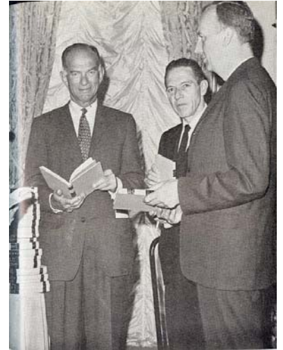
Senador Fulbright con el Subsecretario de estado para Asuntos Culturales, Lucius Battle, en la sede diplomática colombiana en Washington.