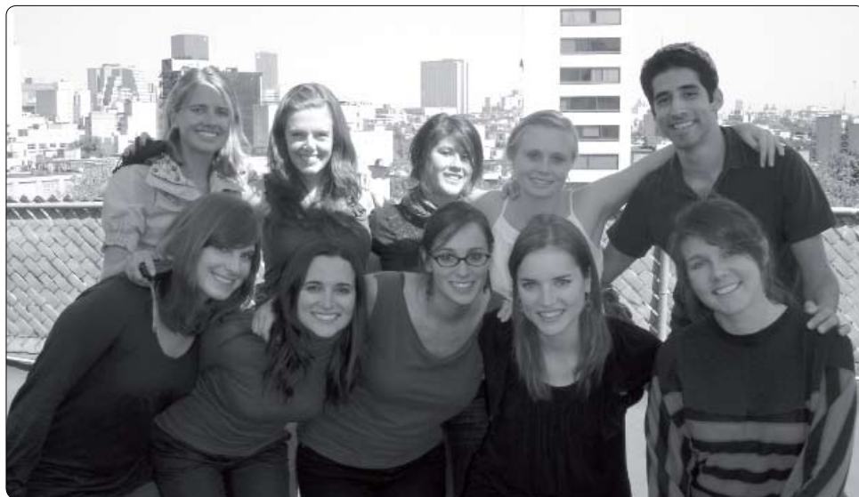
Becarios Fulbright English Teaching Assistant 2009.