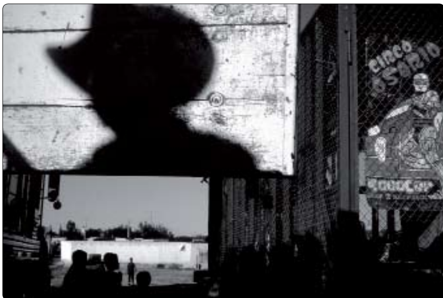
Sain el Alto, Zacatecas, 1985